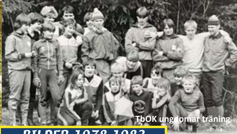
TbOK ungdomar träning