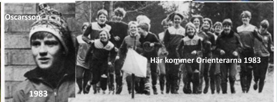
Här kommer Orienterarna 1983